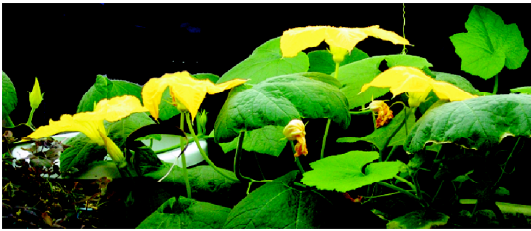
写真2. 開花直後のオモチャカボチャの花。26℃、14時間明期の長日条件下で栽培したオモチャカボチャを明期の始まり(日出に相当する)直後に撮影した。すでに萎れ始めている花が存在する(左から2番目の花)。