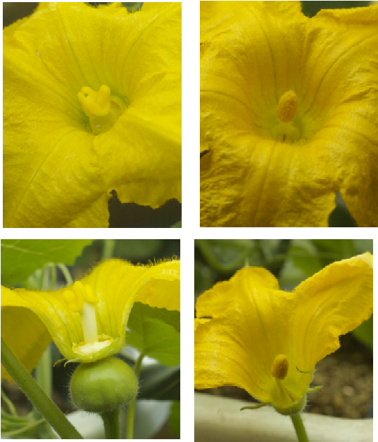
写真1. オモチャカボチャの雌花(右)と雄花(左)。雌花のめしべも、雄花のおしべも花の中心に存在する(上)。内部を見ると、雌花のめしべの周りには初期に発生を停止したおしべの痕跡が3つ見える。雄花のおしべは、基部の花糸がめしべの痕跡を取り囲むように円形に配置している(下)。