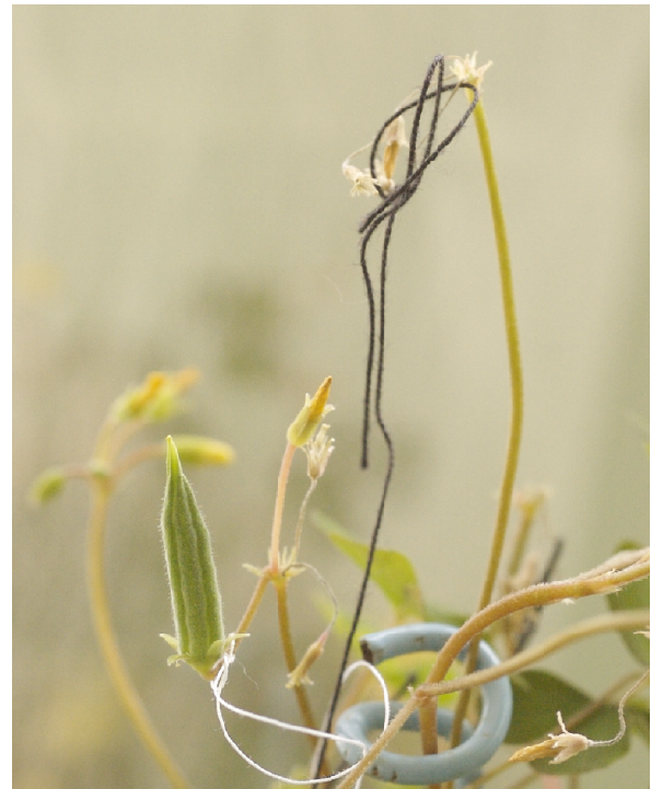
写真6. 雄性不稔HD株では、人工授粉した花は結実したが(白糸)、受粉させなかった花は全て枯れた。