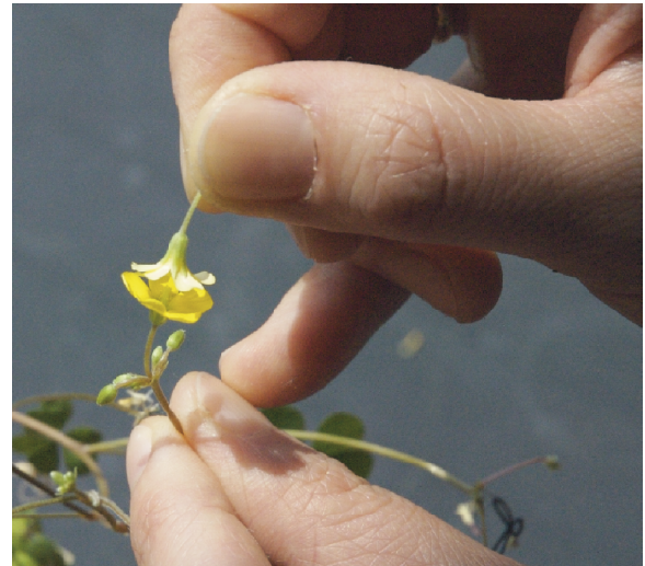
写真4. 雄性不稔のカタバミを用いた交配の操作。花粉を持つ花を切り取り雄性不稔の株の花に押しつけるようにして受粉させる。