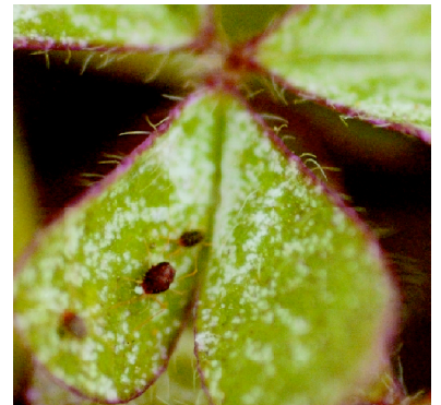
写真7. カタバミハダニとハダニの食害を受けたカタバミの葉。